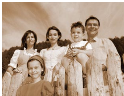
Ihre Almwirte La famiglia della malga

Solo una cosa sicuramente non troverete da noi: la noia!