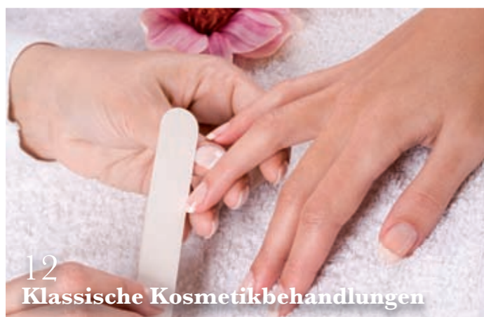
12 Klassische Kosmetikbehandlungen