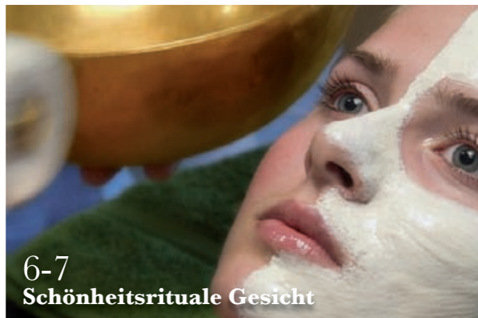
6-7 Schönheitsrituale Gesicht