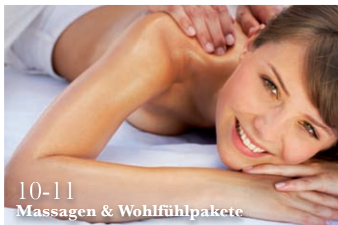
10-11 Massagen & Wohlfühlpakete