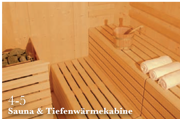
4-5 Sauna & Tiefenwärmekabine