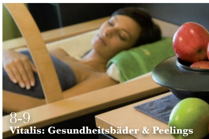
8-9 Vitalis: Gesundheitsbäder & Peelings